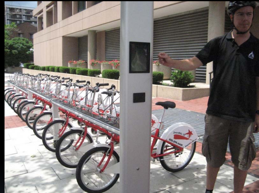
Station in Barcelona