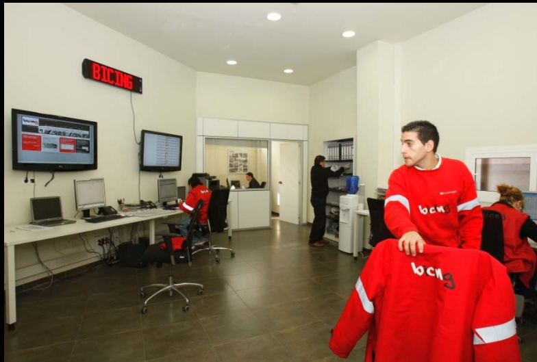
Centrale waar overzicht bewaard wordt