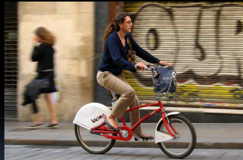
Publieke fiets in Barcelona