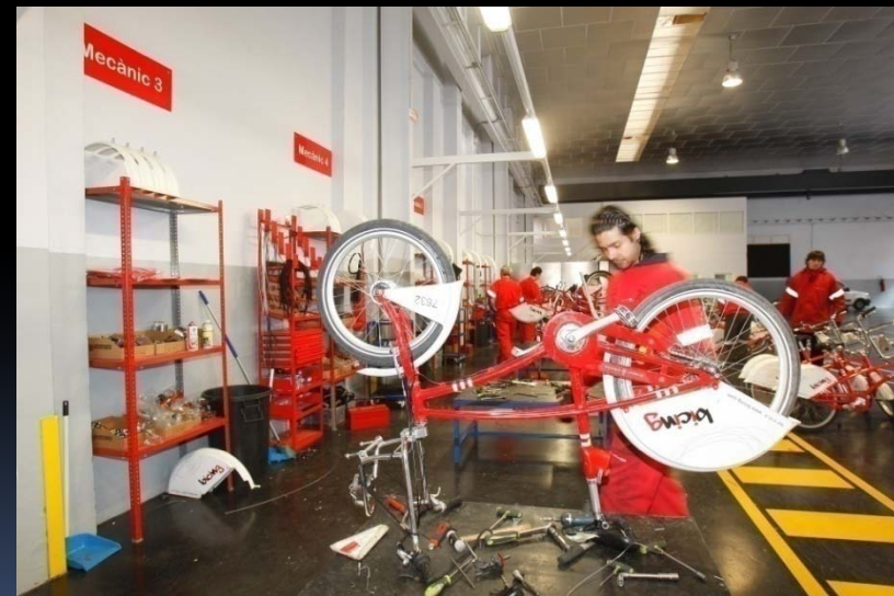
Werkplaats waar herstellingen gebeuren