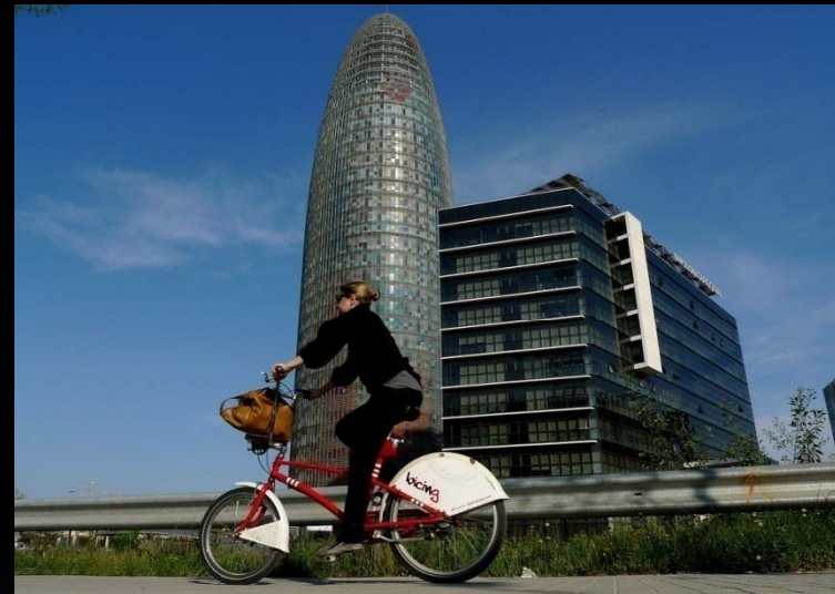
Publieke fiets in Barcelona