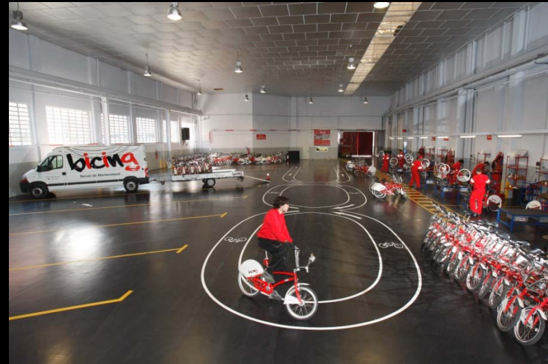
Onderhoud fietsen in Barcelona